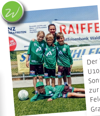
Der TSV Waldkirch, Faustball Kat. U10, hat sich am vergangenen Sonntag für die Finalrunde in Flums zur Ostschweizer Meisterschaft Feld 2023 qualifiziert. Herzliche Gratulation!