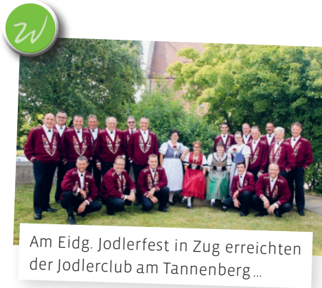
Am Eidg. Jodlerfest in Zug erreichten der Jodlerclub am Tannenberg...