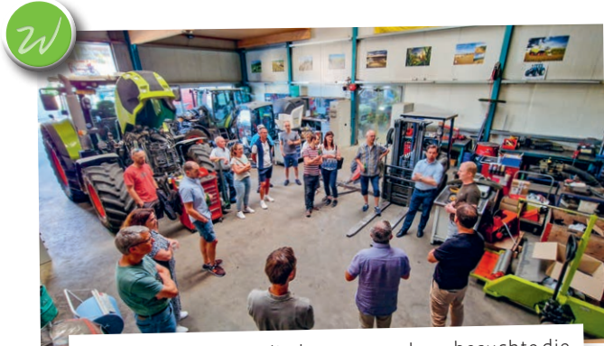
Anlässlich ihrer Mitgliederversammlung besuchte die Mitte Waldkirch-Bernhardzell die Keller Landtechnik GmbH und erhielt dabei einen vertieften Einblick in das umfassende Dienstleistungsangebot.