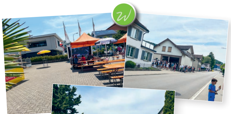
Am vergangenen Sonntag führte das Zeitfahren der Tour de Suisse durch Waldkirch. Herzlichen Dank an alle für die Unterstützung und das Verständnis für die Einschränkungen. Gemeinde Waldkirch