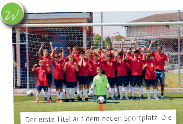
Der erste Titel auf dem neuen Sportplatz: Die C-Junoren des FC Waldkirch-Bernhardzell gewinnen die Frühjahrs-Meisterschaft. Herzliche Gratulation!