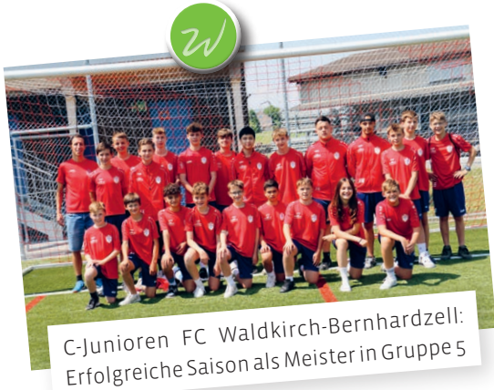
C-Junoren FC Waldkirch-Bernhardzell: Erfolgreiche Saison als Meister in Gruppe 5