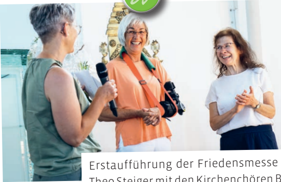
Erstaufführung der Friedensmesse von Theo Steiger mit den Kirchenchören Bernhardzell und Waldkirch.