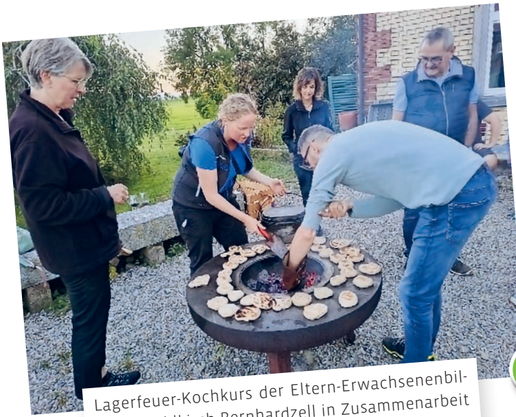
Lagerfeuer-Kochkurs der Eltern-Erwachsenenbildung Waldkirch-Bernhardzell in Zusammenarbeit mit Balmer Trekking und Korkira.