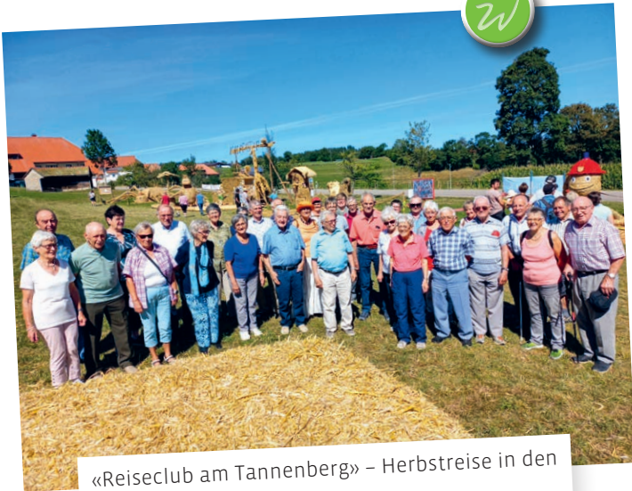
«Reiseclub am Tannenberg» – Herbstreise in den Schwarzwald