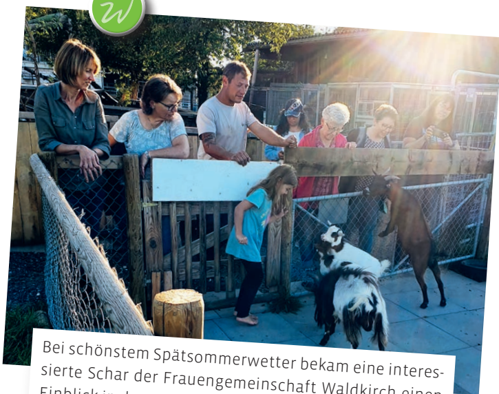
Bei schönstem Spätsommerwetter bekam eine interessierte Schar der Frauengemeinschaft Waldkirch einen Einblick in den Erlebnisbauernhof Wannewis.