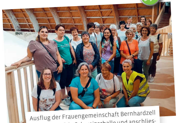
Ausflug der Frauengemeinschaft Bernhardzell zum Salzwerk in Schweizerhalle und anschließende Schleusenfahrt auf dem Rhein