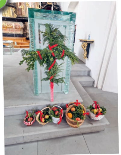
Viele fleissige Hände haben Palmkreuze und Körbchen für die Prozession und den Gottesdienst am Palmsonntag gebunden. Herzlichen Dank.