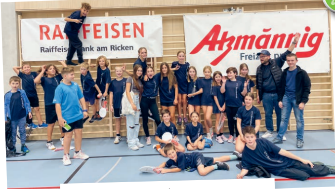
Toggenburger Spieltag 2023. Junioren Jg. /14 belegen den 3. Platz.