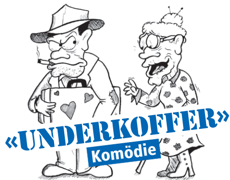
Illustration: Thomas Hättenschwiler