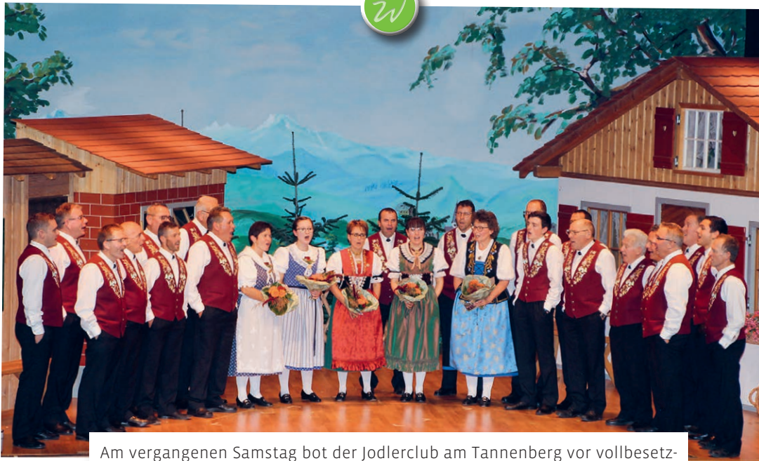
Am vergangenen Samstag bot der Jodlerclub am Tannenbergtal vor vollbesetzter Saal eine stimmungsvolle Unterhaltung. Zahlreiche Gäste genossen das abwechslungsreiche Programm.