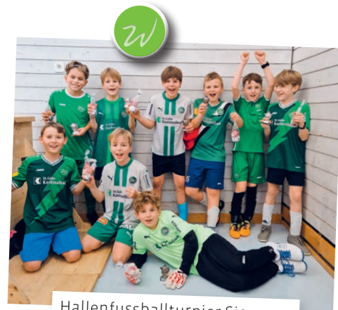
Hallenfussballturnier Sieger – Schüler Kat. E