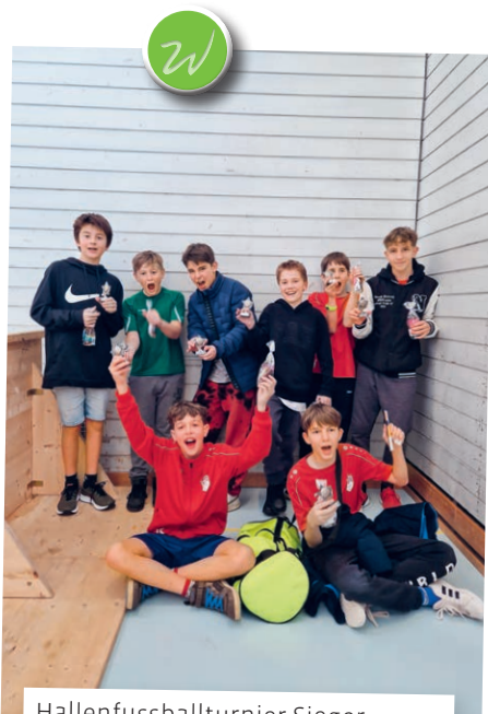
Hallenfussballturnier Sieger – Schüler Kat. D