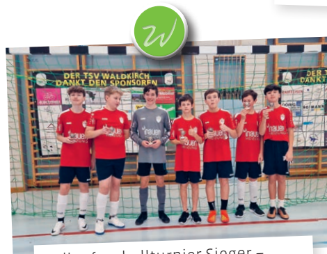
Hallenfussballturnier Sieger – Schüler Kat. C